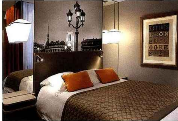
Hôtel La Lanterne 12 rue de la Montagne Sainte-Geneviève 75005 Paris hotel-la-lanterne.com/fr

voyages immobiles", ainsi qu'elle se définit, présente à son actif près d'une vingtaine de boutiques-hôtels, dont le Montmartre mon Amour à Paris, le Royal Ours Blanc à l'Alpe-d'Huez, l' Excelsior à Nice... Le premier de sa liste,